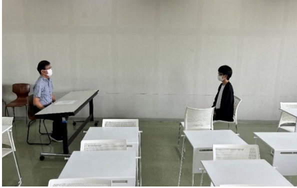
<個人面接演習の様子>