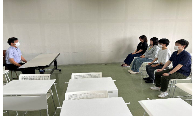
<集団面接演習の様子>

面接のオリエンテーションでは、2つの人物評価の視点（①教職への情熱、人柄、適性等、②教職教養に関する知識・理解）について、試問例を示しながら解説しました。全国的な傾向としては、教職への情熱、人柄、適性等についての試問（通常試問）が多く行われています。しかし、教職教養に関する知識・理解（教職教養試問）を取り入れている自治体もあることから、受験自治体によっては、教職教養試問も交えて演習しています。また、本年度は、試問数415で構成される試問集を作成し、演習に役立てています。